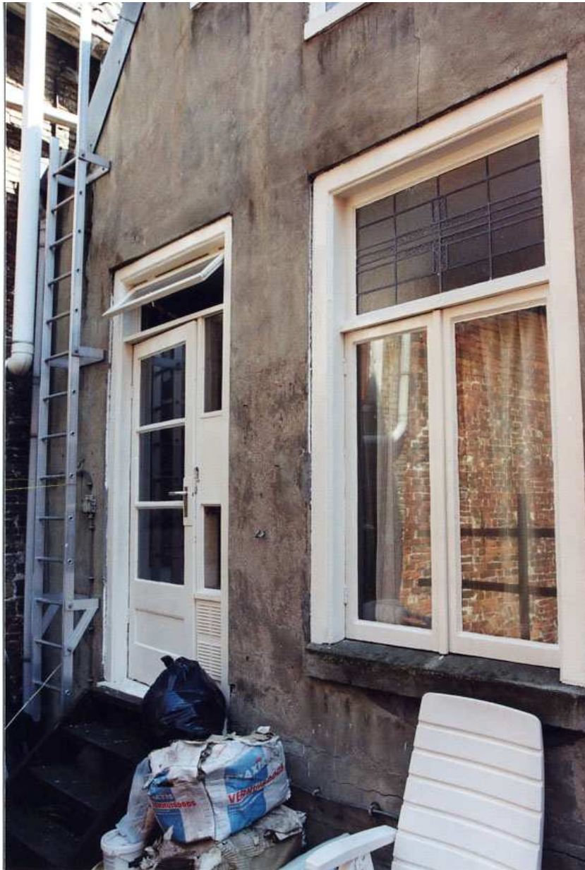
De achtergevel ter hoogte van de verdieping en de zolder.

Ze geven de plaats van de gordingen van de kapconstructie aan. Deze ankers dateren mogelijk uit de late 19 de eeuw. Bij een beschadiging van de pleister is te zien dat de gevel opgetrokken is van vrij kleine gelige bakstenen. Of al het muurwerk van gele bakstenen is opgetrokken valt niet te zeggen.